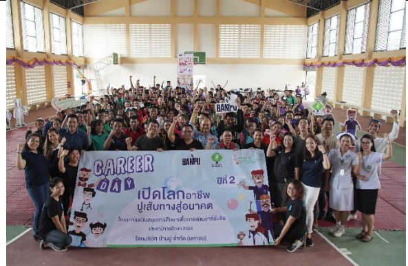
พนักงานบ้านปูฯ ที่ต้นแบบอาชีพ และน้องๆ จากโรงเรียนเวียงเจดีย์ ร่วมเปิดกิจกรรม Career Day: เปิดโลกอาชีพ ปูเส้นทางสู่นาคต ปีที่ 2