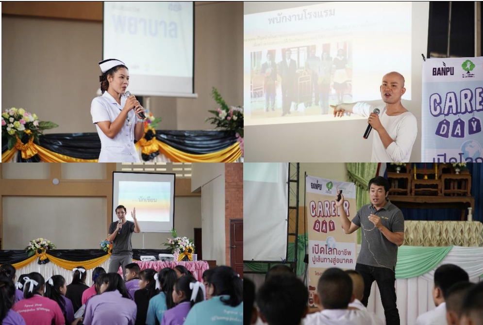
กลุ่มพี่ต้นแบบอาชีพจากหลากหลายสาขาขณะถ่ายทอดประสบการณ์อาชีพของตนเองให้กับน้องนักเรียนที่เข้าร่วมกิจกรรม