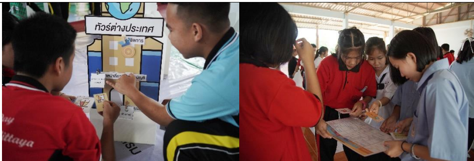
เด็กนักเรียนจาก 6 โรงเรียนทางภาคเหนือขณะเข้าร่วมกิจกรรม Career Day: เปิดโลกอาชีพ ปูเส้นทางสู่อนาคต ปีที่ 2