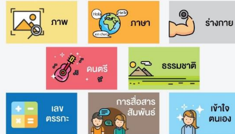
ภาพตัวอย่างการ์ดเกมช่วงละลายพฤติกรรม ที่ช่วยให้เด็กๆ ทราบถึงทักษะและสายเรียนที่จำเป็นสำหรับแต่ละอาชีพมากยิ่งขึ้น