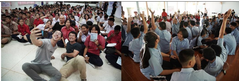
น้องๆ ขณะร่วมฟังคำแนะนำจากพี่ต้นแบบอาชีพอย่างสนุกสนานและเป็นกันเอง